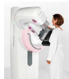
マンモグラフィーによる検査イメージ