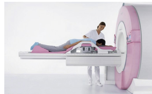
MRIによる検査イメージ

*金属類を体内に埋め込んでいる方（ペースメーカー、人口内耳、中耳、チタン以外の脳動脈クリップなど）は、検査をお受けいただくことができません。 *刺青、アートメイキングを施している方、閉所恐怖症や撮影中にじっとしていることができない方、妊娠初期の方は予約時、もしくは事前にお電話でご確認下さい。