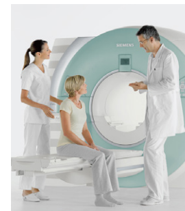
MRIによる検査イメージ