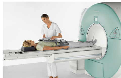
MRIによる検査イメージ

* 金属類を体内に埋め込んでいる方（ペースメーカー、人口内耳、中耳、チタン以外の脳動脈クリップなど）は、検査をお受けいただくことができません。 * 刺青、アートメイキングを施している方、閉所恐怖症や撮影中にじっとしていることができない方、妊娠初期、または生理中の方は予約時、もしくは事前にお電話でご確認下さい。